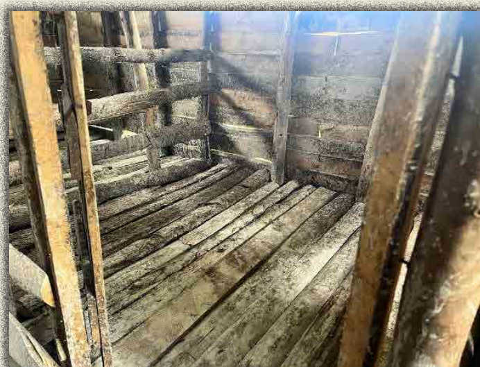
Stérilisation de la porcherie