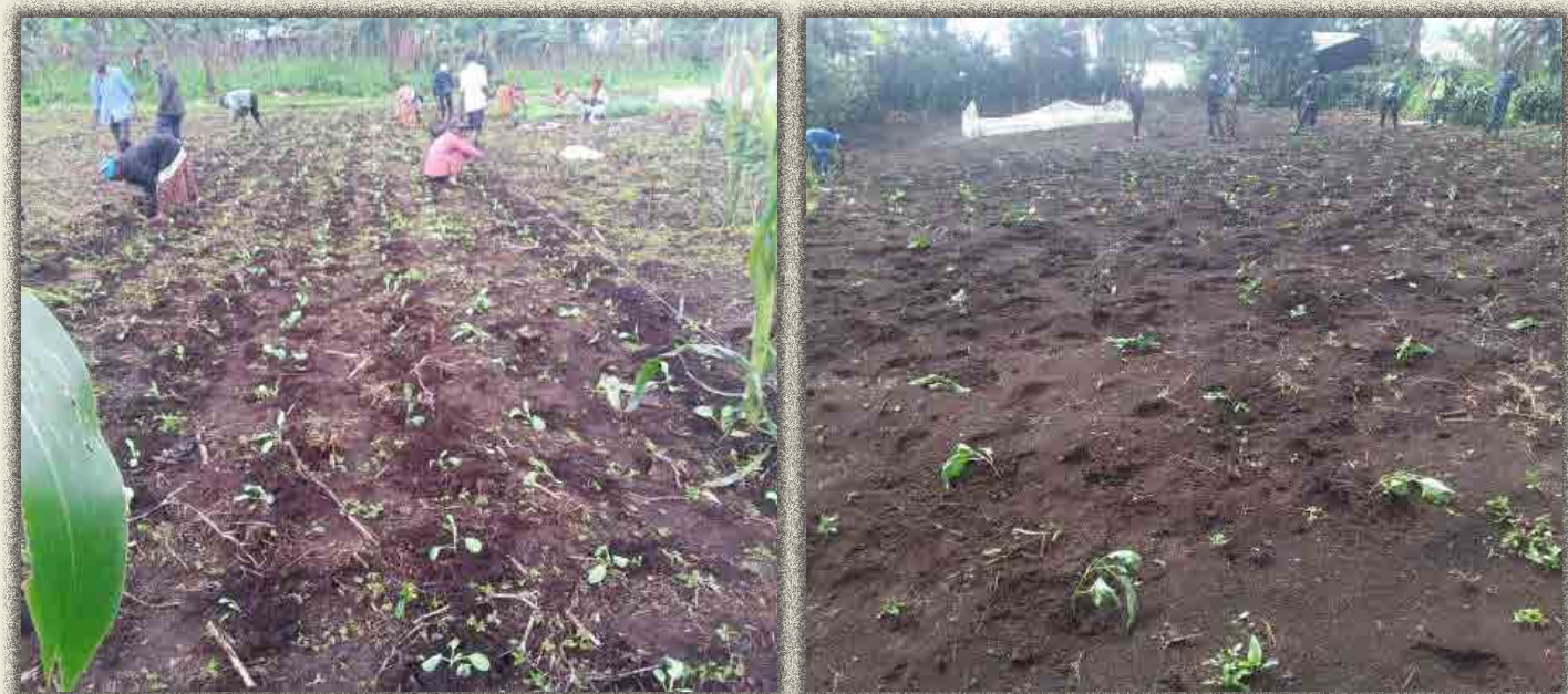
Champ communautaire de Mulangala et Kahungu

Ces travaux ont été une occasion pour les communautés de renforcer leur cohésion sociale et promouvoir l'esprit du travail en équipe.