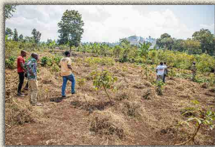
Champ de Kahungu

Dans chacun des deux villages un comité de gestion a été mise en place afin d'assurer un suivi rapproché du champ communautaire et orienter les autres membres (bénéficiaires).