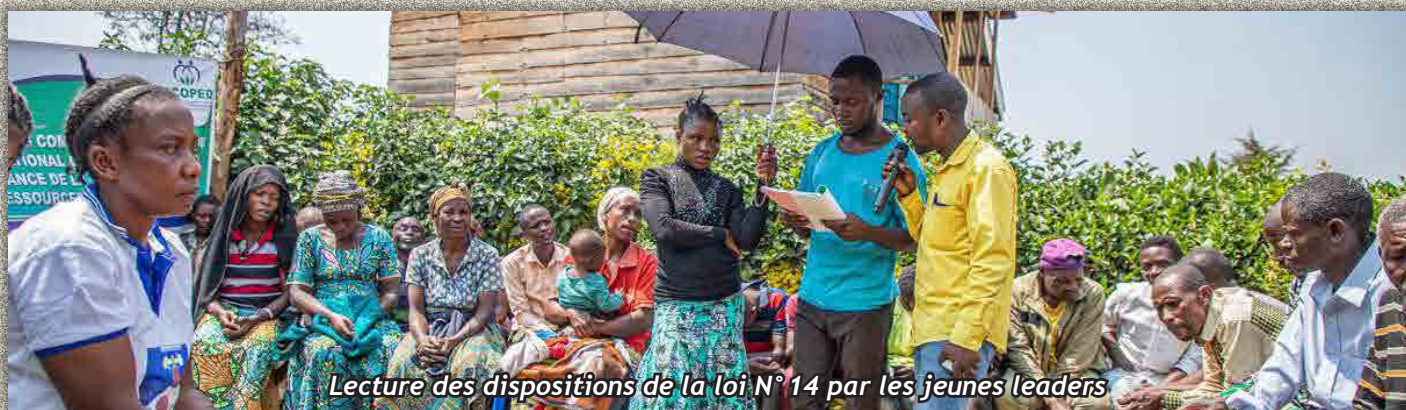
Lecture des dispositions de la loi N° 14 par les jeunes leaders

C'est ainsi qu'un lisait en français et l'autre la traduction en swahili avec l'appui de l'équipe ACOPEL.