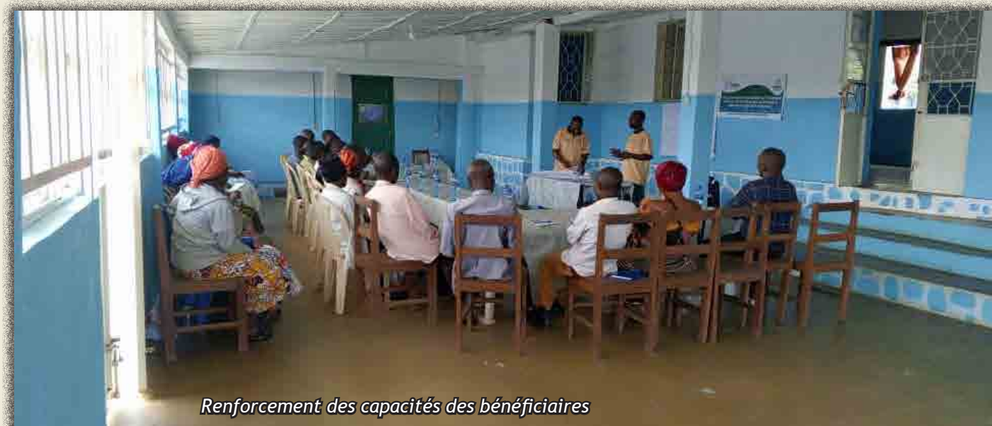
Renforcement des capacités des bénéficiaires