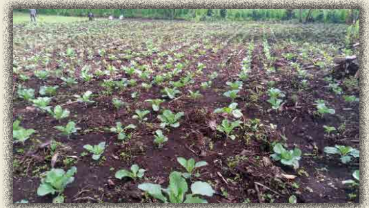
Suivi phyto sanitaires