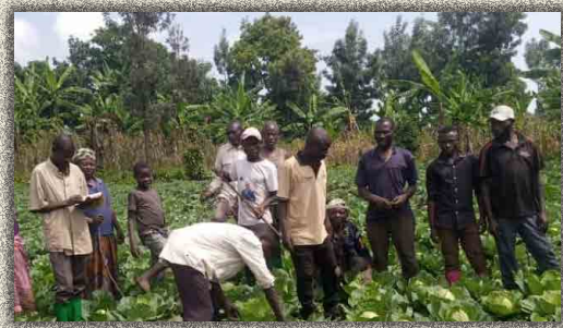
Entretien des champs communautaires