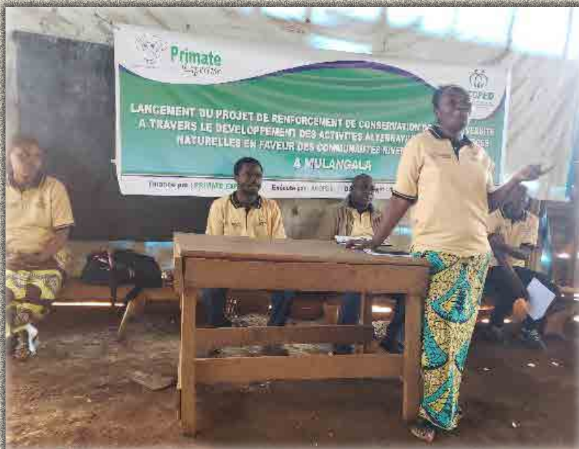
Echanges entre participants

Tous les Chefs de villages (Kahungu et Mulangala) ainsi que les bénéficiaires ont manifesté leur satisfaction pour l'appui de l'ACOPEP à travers Primate Expertise (PEX). Ils ont montré que l'appui est d'une importance capitale non seulement pour l'amélioration tant soit peu des conditions de vie des communautés mais aussi pour la diminution de la forte dépendance des ressources naturelles du PNKB par la communauté.