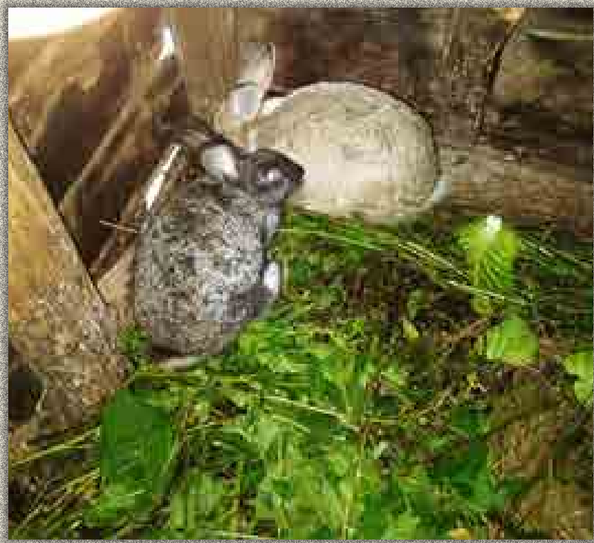
Elevage des lapins à Mulangala

De cet appui, il y a eu 2 cas de mortalités, la mise bas de 5 lapereaux et 66 chiots. L'effectif actuel des lapins auprès des bénéficiaires s'élève à 31 individus et 108 cobayes.