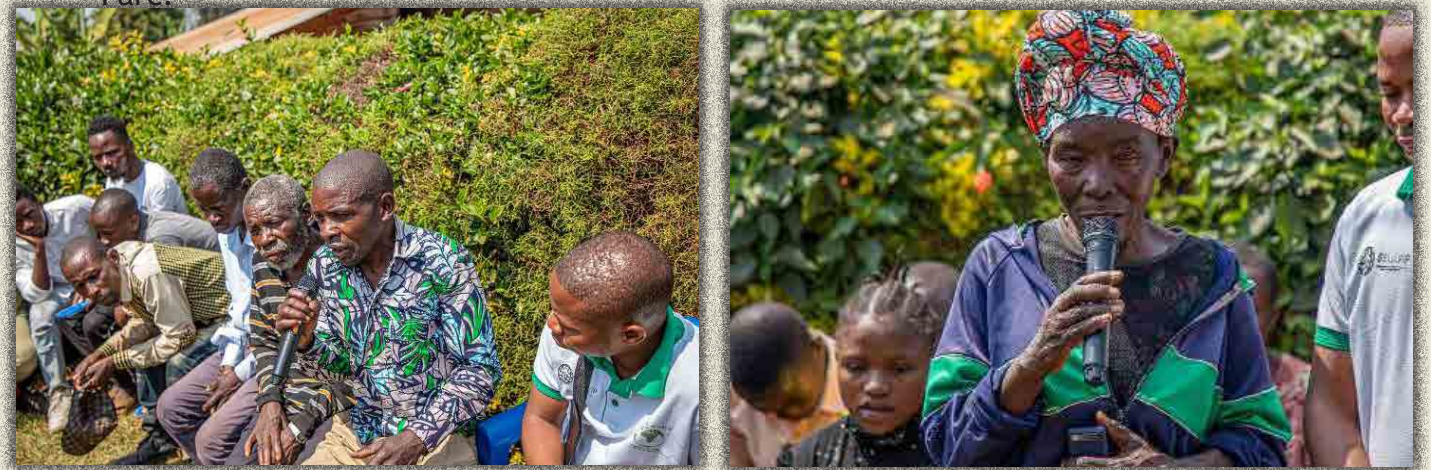
Questions des participants