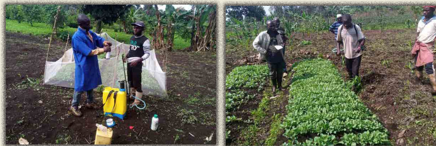
Suivi phyto sanitaire des plantules des aubergines, choux à Kahungu

Ensuite, un suivi phyto sanitaire a été assuré par l'agronome en collaboration avec les bénéficiaires communautaires formés. Ci-après les photos illustrative