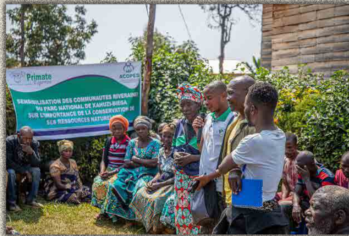
Participants de Kahungu