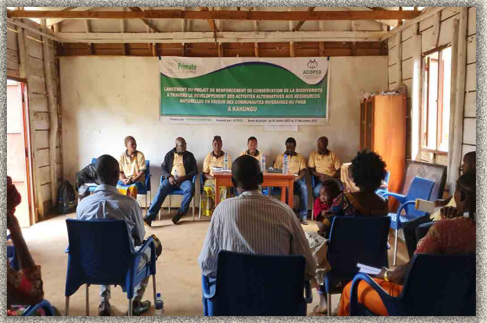
Participants au lancement du projet à Kahungu