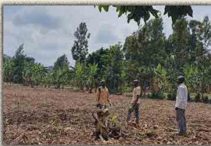
Champ de Mulangala