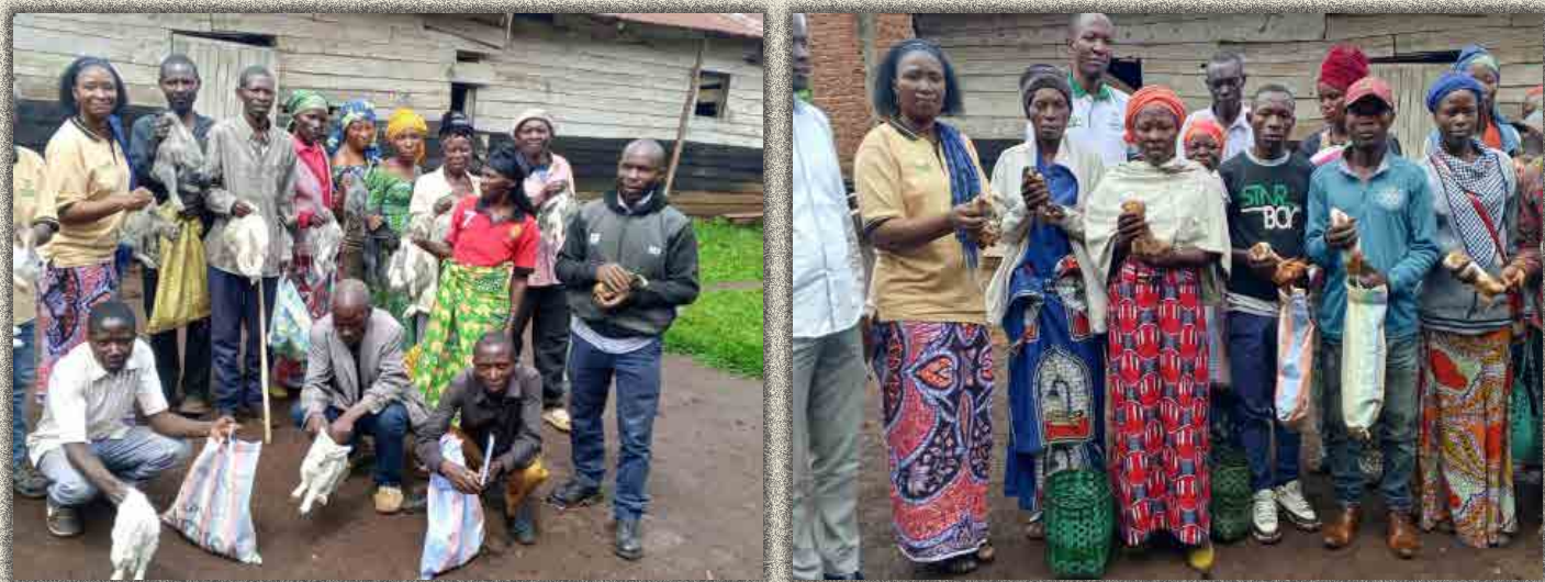
Appui en géniteurs des lapins et cobayes

Ainsi, 11 ménages vulnérables ont bénéficié d'un appui en élevage des lapins en raison de 2 géniteurs par bénéficiaire (soit 28 lapins distribués) et 14 autres en élevages des cobayes dont 3 géniteurs par ménage bénéficiaire (soit 42 cobayes distribués) (Cfr. liste des bénéficiaires en annexe 2).