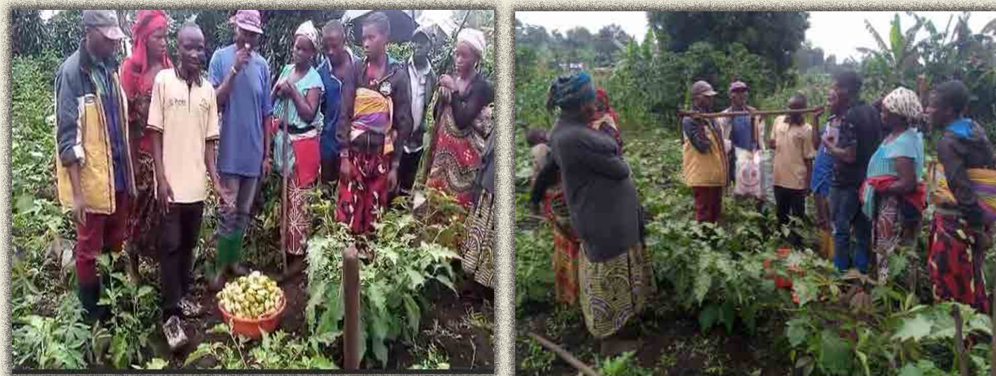
Récolte d'aubergines et évaluation du poids